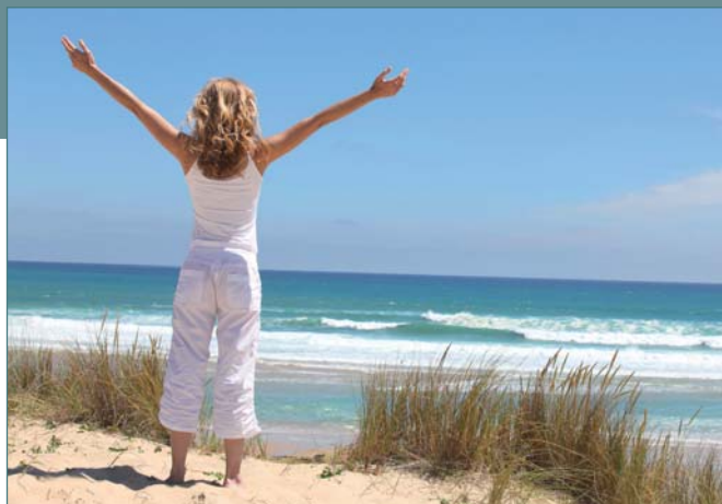
Libérée de la cigarette et des pollutions ?

J'ai 67 ans et je fume depuis l'âge de 20 ans, j'ai souvent eu le désir d'arrêter et j'ai essayé tous les artifices chimiques que la pharmacologie moderne a pu apporter sans aucun résultat. En essayant le Bol d'air®, je pensais d'abord à alimenter mon corps en oxygène ; mais au fur et à mesure de mes séances, mon envie de fumer s'est éteinte d'elle-même. J'arrive à ne fumer que les cigarettes qui me plaisent et ma consommation journalière a diminué de façon significative (je suis passé de 30 cigarettes à 10 par jour), sans efforts, sans prise de poids, sans effet de manque et, rien que pour cela, je continuerai à utiliser le Bol d'air Jacquier®. »